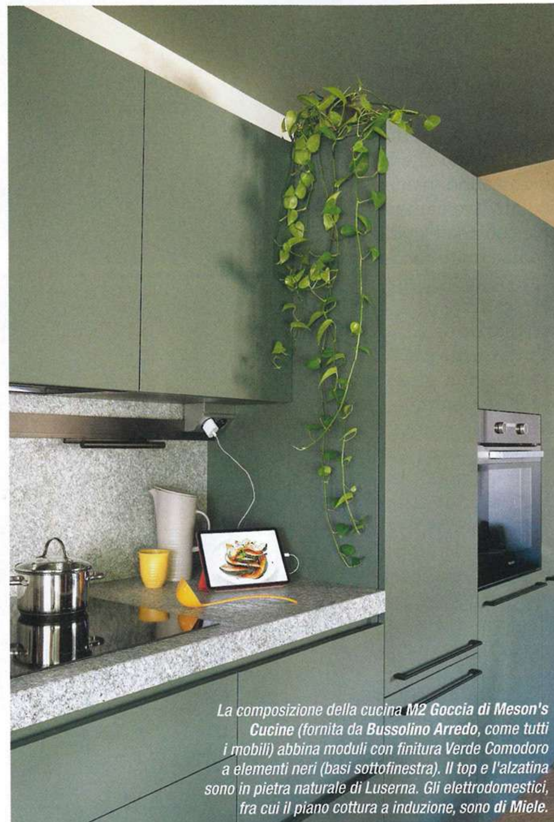
La composizione della cucina M2 Goccia di Meson's Cucine (fornita da Bussolino Arredo, come tutti i mobili) abbina moduli con finitura Verde Comodoro a elementi neri (basi sottofinestra). Il top e l'alzatina sono in pietra naturale di Luserna. Gli elettrodomestici, fra cui il piano cottura a induzione, sono di Miele.

Fra le finiture che riconnettono al territorio, c'è la pietra di Luserna, impiegata come top e alzatina fra basi e pensili. Si tratta di una roccia dalla struttura lamellare, cioè composta da strati sovrapposti che la rendono particolarmente resistente. È composta principalmente da feldspato, quarzo e mica, e può presentare diverse finiture, da quella naturale a quella levigata o bocciardata. La sua colorazione tipica varia dal grigio-verde al grigio-azzurro, con possibili venature più scure o più chiare: una varietà che permette di sposarla bene con diversi materiali, dal legno all'acciaio al vetro. Resistente al calore, alle macchie e all'umidità, si pulisce con un panno umido e detergenti neutri.