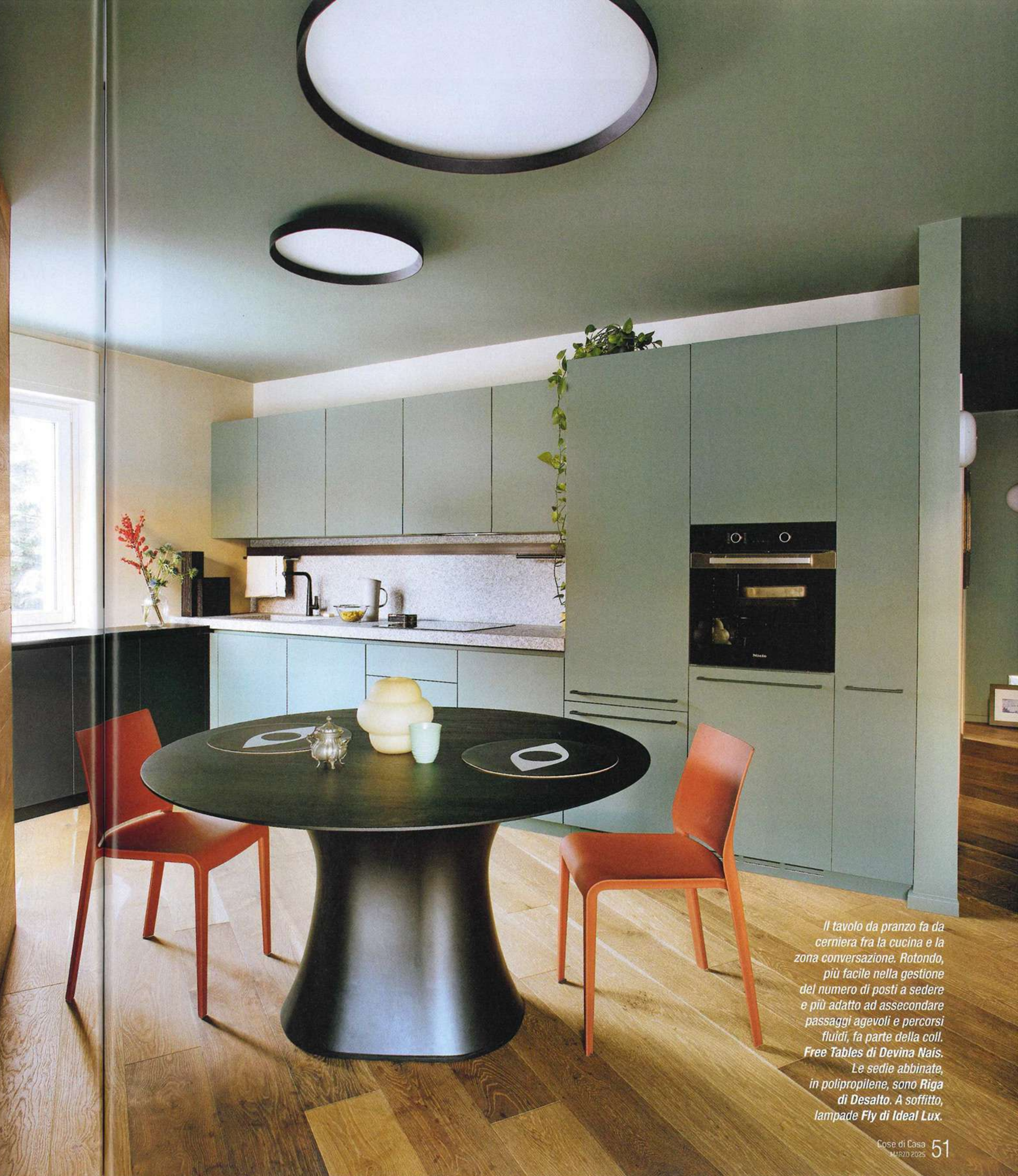
Il tavolo da pranzo fa da cerniera fra la cucina e la zona conversazione. Rotondo, più facile nella gestione del numero di posti a sedere e più adatto ad assecondare passaggi agevoli e percorsi fluidi, fa parte della coll. Free Tables di Devina Nais. Le sedie abbinato, in polipropilene, sono Riga di Desalto. A soffitto, lampade Fly di Ideal Lux.